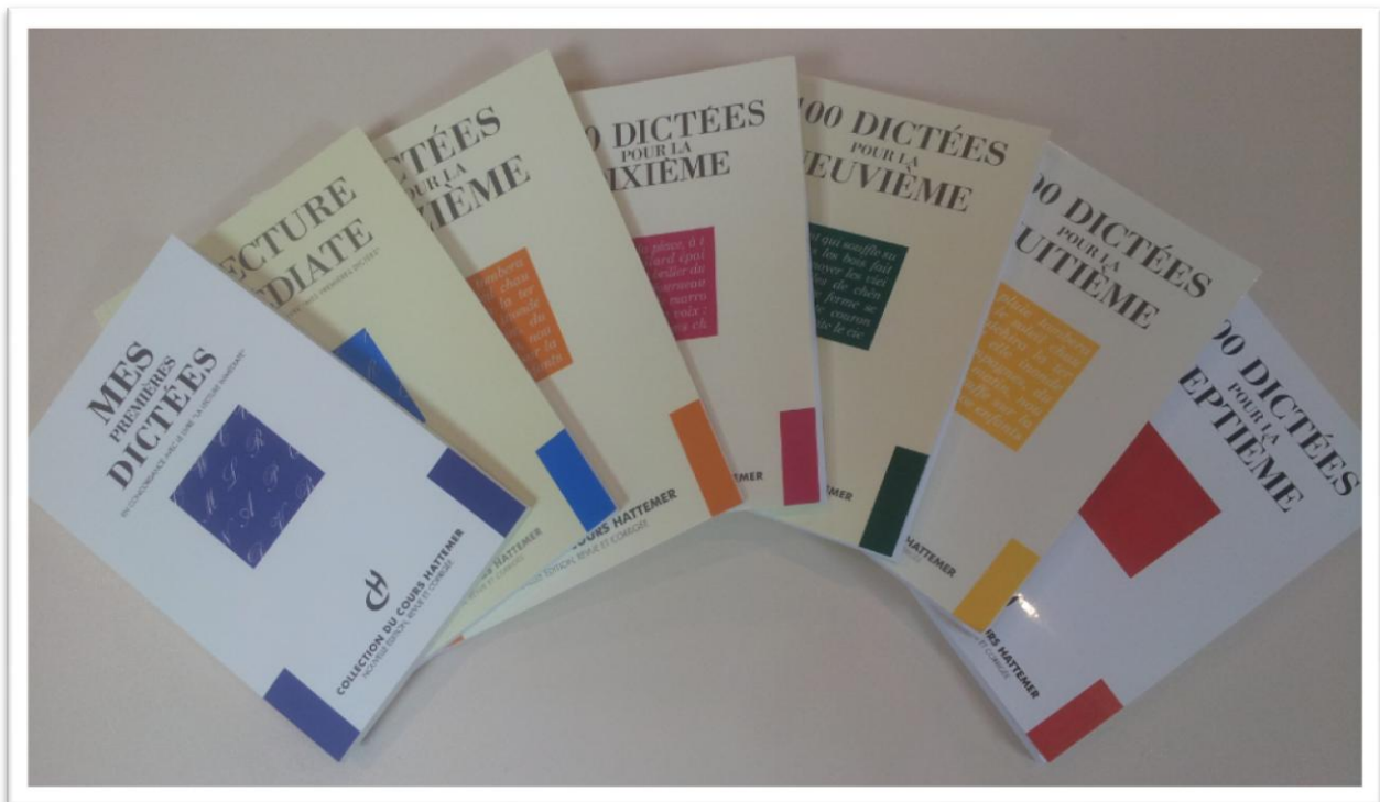
(Collection Hattemer "Les 100 dictées ")

L'usage de la dictée s'est généralisé en France en 1850 et chez Hattemer, la dictée est un rituel quotidien depuis 1885 qui commence à la 12 ème pour se terminer à la 7 ème .