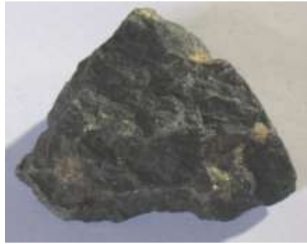
Un échantillon de basalte