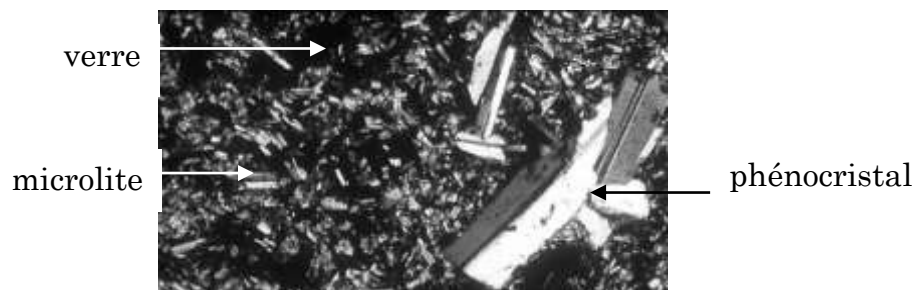
Observation microscopique d'une lame de roche volcanique

Les roches volcaniques ont une structure microlitique car elles ont majoritairement des microlites.