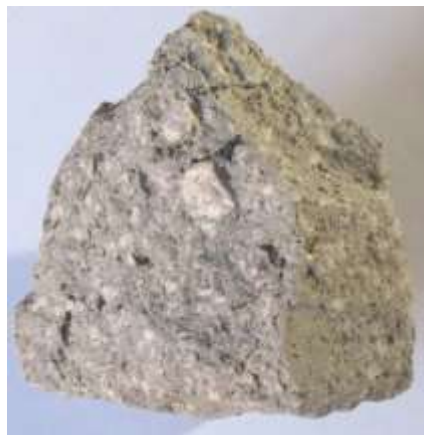
Un échantillon d'andésite